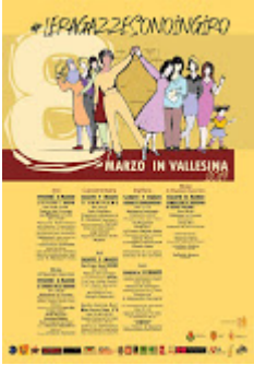
5le ragazze sono in giro.jpg 113K