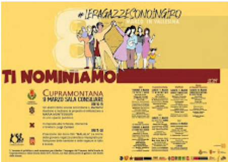
ti nominiamo160_n.jpg 85K