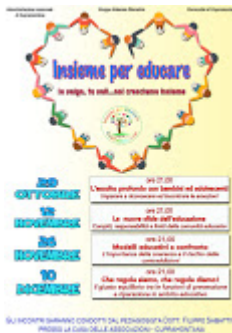
locandina educare insieme - Copia.jpg 965K