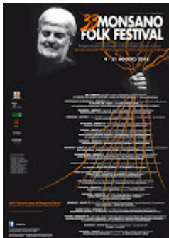
LOCANDINA 2018_piccola.jpg 408K