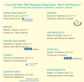
Date concertiSUONIdalPASSATO.PNG 220K