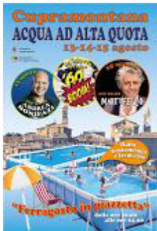
acqua ad alta quota.jpg 124K