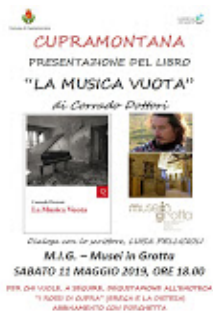
Locandina presentazione Dottori.jpg