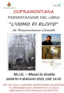
Locandina presentazione Cimatti.jpg