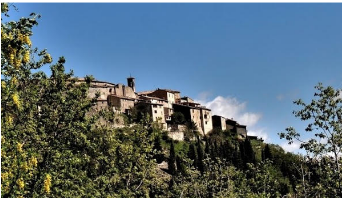
Cupra in Camminata!!