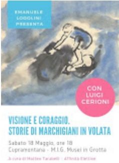
Visione e Coraggio6_n.jpg 36K